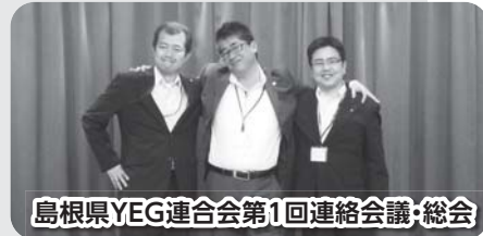
島根県YEG連合会第1回連絡会議・総会