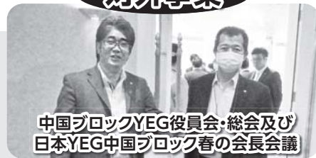
中国ブロックYEG役員会・総会及び日本YEG中国ブロック春の会長会議

また、これからは暑い、夏祭りのシーズンです。地元平田まつりでは食べ物の他、地上に舞い降りた星空を演出!? 他、水郷祭での出店計画も着々と進んでおりますので、ご期待ください。