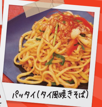
パッタイ(タイ風焼きそば)