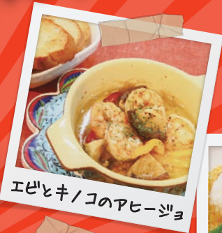
エビとキノアヒーゾ