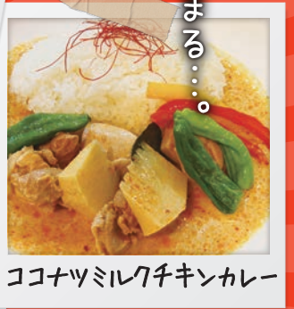
ココナツミルクチキンカレー