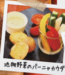
地物野菜のパンケーキ