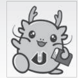
公立大学法人島根県立大学 マスコットキャラクター オロン

お問い合わせ 公立大学法人島根県立大学出雲キャンパス 管理課・地域連携推進室 TEL:0853-20-0200 FAX:0853-20-0201 E-Mail:i-koryu@u-shimane.ac.jp