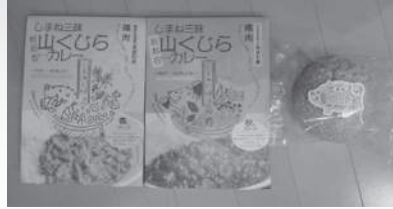
＜山くじらカレー春・秋とカレーパン＞

出雲キャンパスでは「自ら考え行動できる専門職業人」をめざす人材像として掲げ、看護師、保健師、管理栄養士、助産師の養成を行っています。おおよそ600名の学生と教職員が一体となり、「地域」「人間大好きな精神」を大切に、教育・研究、地域活動を展開しています。授業では、地域の方々のご自宅を訪問させて頂く「基礎看護学習I(家庭)」や、地域医療への理解を深めることを目的とした島嶼地域・中山間地域でのフィールド学習「島根の地域医療」等、本学ならではのカリキュラムを展開しています。地域・産学官連携では、美郷町のおおち山くじらを活用した新商品開発やしまね健康寿命延伸プロジェクトにおける健康に配慮したお弁当・お惣菜等の開発等に取り組んでいます。また、地域の皆様、看護職や管理栄養士・栄養士等の専門職を対象とした、公開講座や出前講座、研修会等の開催、キャンパスツアー等を行っています。地域に密着した大学ならではの学び、地域活動を展開しています。いつでもお気軽にお声がけください。