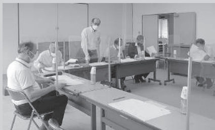
会館整備検討委員会

新会館を検討する第10回会館整備検討委員会を7月19日開催、建物は木造2階建ガルバリウム鋼板屋根金属系サイディング張り、延べ床面積約470㎡（現在の商工会議所面積から約15%縮小）、これを敷地南側（線路寄り）に配置と計画、コンパクトなレイアウトながら多目的トイレ導入など、誰もが使いやすい会館をめざし議論が行われました。委員会では今後さらに具体的な検討を進める予定です。